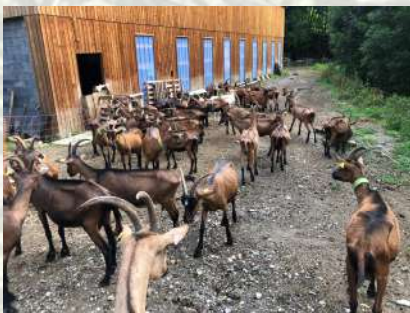
Chèvrerie de Cazaux