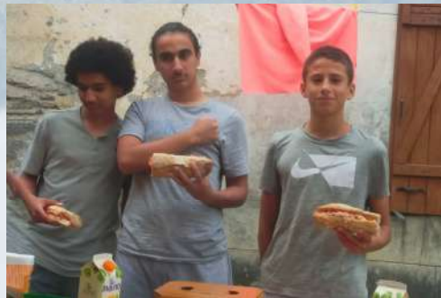
Préparation et dégustation de sandwich