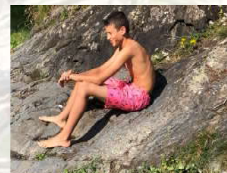
Des bains , torrent d'Ôo