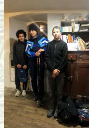
Des randos , des visites